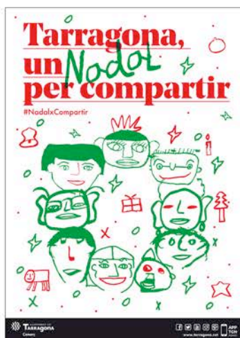
Campanya "Tarragona, un Nadal per Compartir"