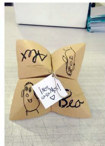
Imatge gràfica d'una invitació de boda