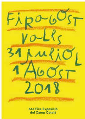
Concurs del Cartell per a Firagost de Valls 2018