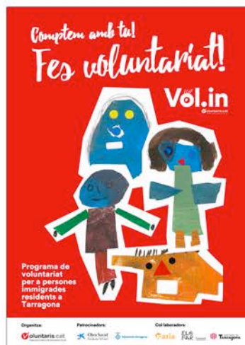
Imatge gràfica del projecte Vol.in, de la FCVS