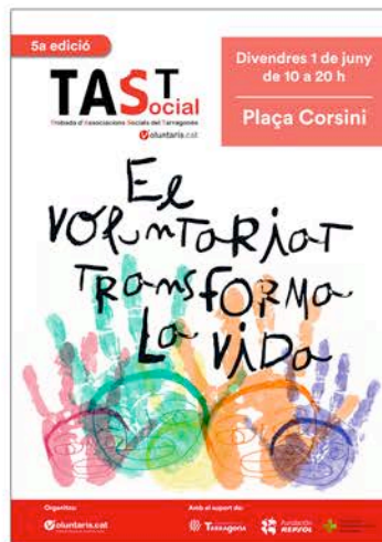
Imatge gràfica de la 5a edició del Tast Social