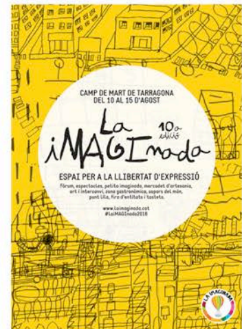
Imatge gràfica de la 10a edició de La Imaginada